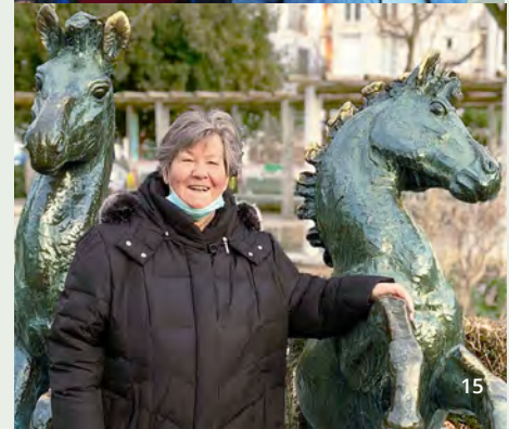
Ausflüge mit Bewohnerinnen